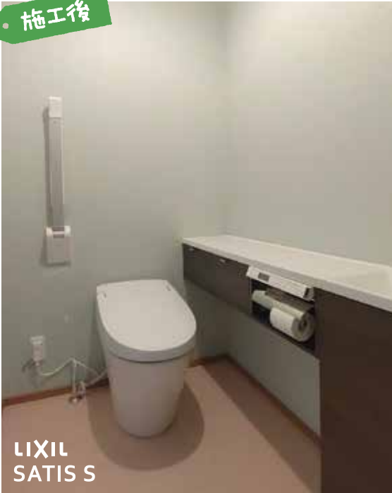
LIXIL SATIS S