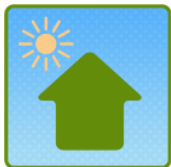
①太陽が汚れを浮かす