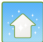
③いつも家はピカピカ